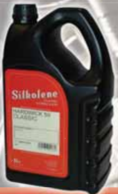
HARDWICK 50 CLASSIC