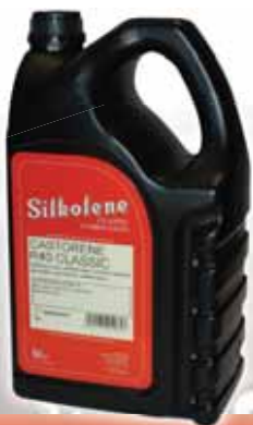
CASTORENE R40 CLASSIC

Motorno ulje na bazi ricinusovog ulja u kombinaciji sa sintetičkim uljem i aditivima.