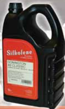
DONINGTON 40 CLASSIC

Motorno ulje bez aditiva za starodobna vozila.