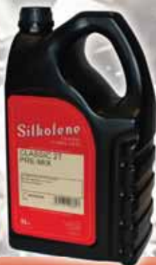
CLASSIC 2T PREMIX

Ulje na bazi sintetičkih estera u gradaciji SAE 40 za dvtaktne i Wankel motore.