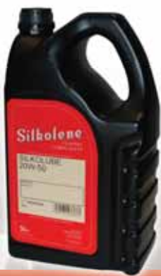
SILKOLUBE 20W-50 CLASSIC

Multigradno motorno ulje za obnovljene klasične motocikle.