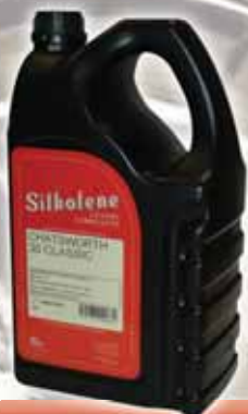
CHATSWORTH 30 & 40 CLASSIC