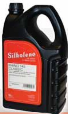
RHINO 140 CLASSIC

Višenamjensko blago EP aditivirano mjenjačko ulje.