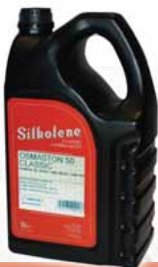
OSMASTON 50 CLASSIC

Visokokvalitetno motorno ulje bez deterdženata.